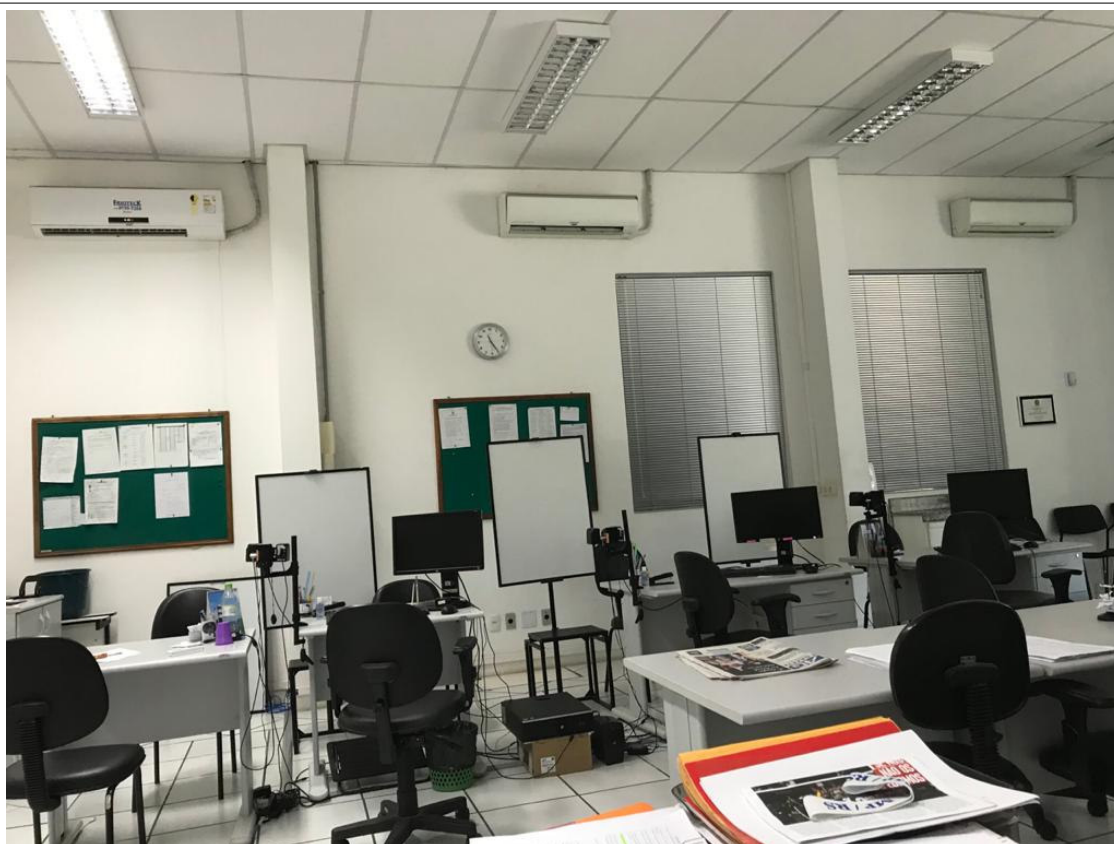
Foto 02: Evaporadores, 24.000 BTU, instalados na sala principal do Cartório