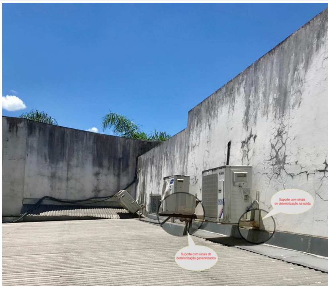
Foto 01: Compressores, 24.000 BTU, das máquinas instaladas na sala de principal do Cartório