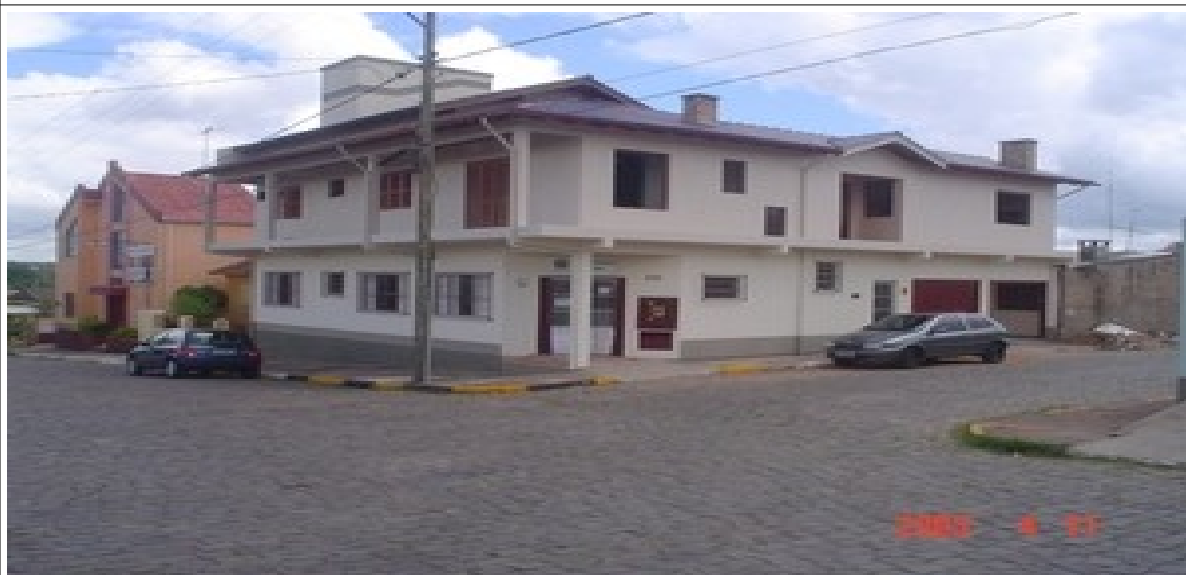
Figura 2 – Local onde a placa será instalada