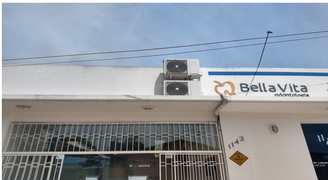
Fotos 3 e 4 – Situação de instalação das unidades condensadora e evaporadora, item 3.1.2