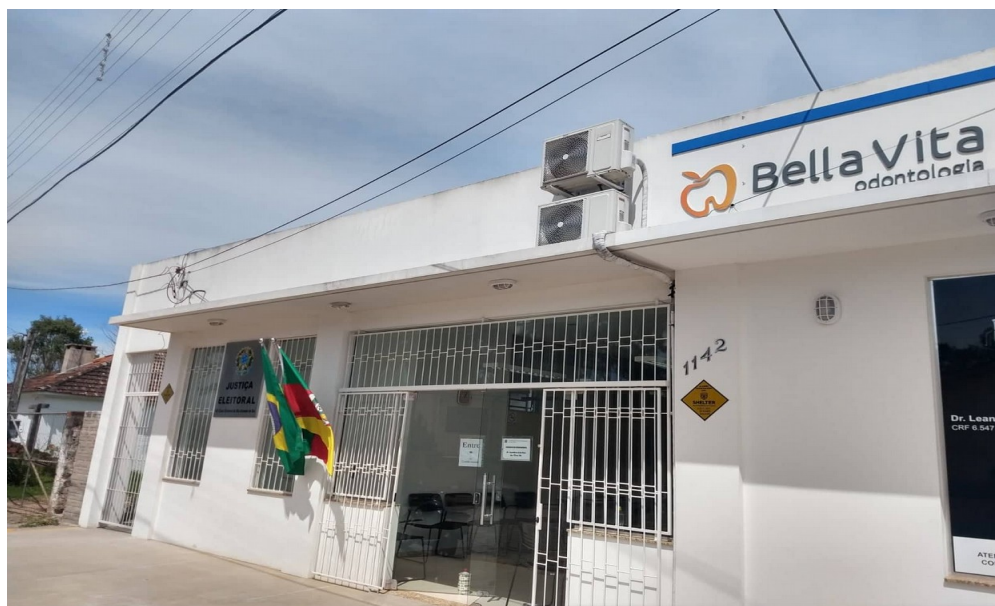
Fotos 1 e 2 – Situação de instalação das unidades condensadora e evaporadora, item 3.1.1