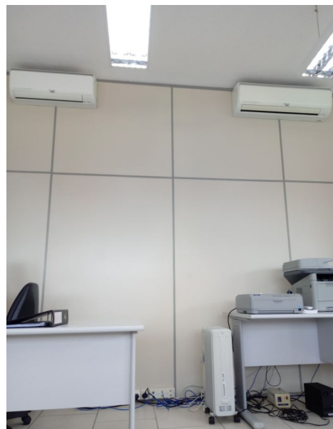
Condicionadores de ar 12.000 e 24.000 BTUs (Cartório)