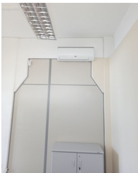
Condicionador de ar 12.000 BTUs (sala Juiz)