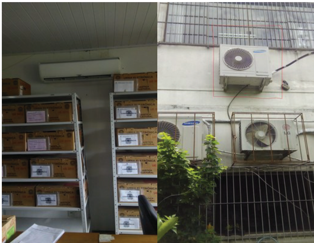
Foto 7 – Situação de instalação das unidades condensadora e evaporadora, item 3.1.7