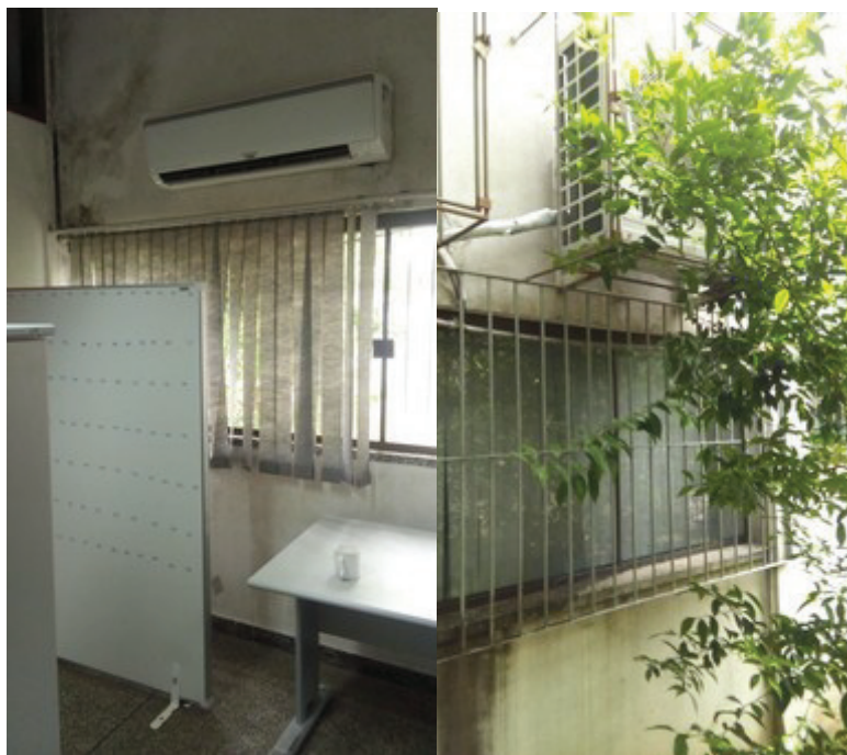
Foto 3 – Situação de instalação das unidades condensadora e evaporadora, item 3.1.3