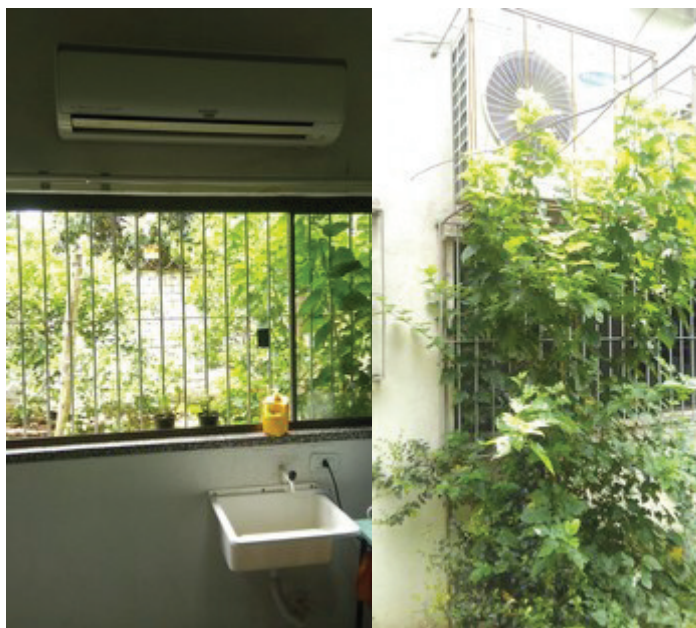
Foto 2 – Situação de instalação das unidades condensadora e evaporadora, item 3.1.2