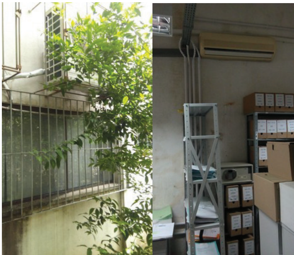
Foto 4 – Situação de instalação das unidades condensadora e evaporadora, item 3.1.4