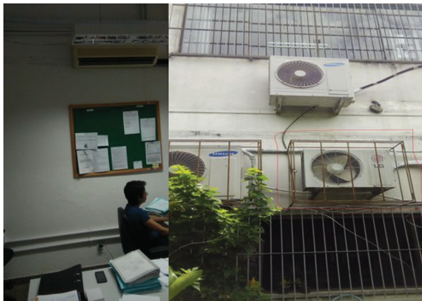
Foto 1 – Situação de instalação das unidades condensadora e evaporadora, item 3.1.1