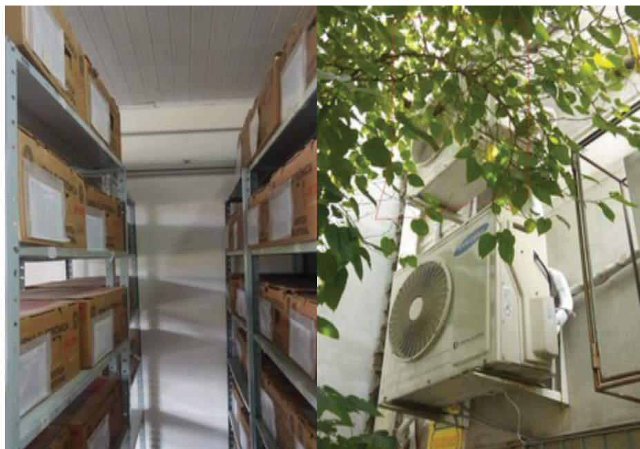
Foto 6 – Situação de instalação das unidades condensadora e evaporadora, item 3.1.6