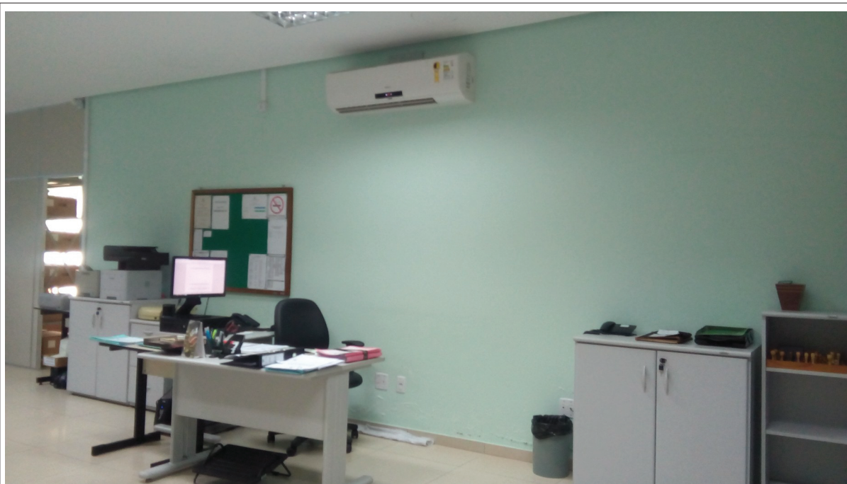
Foto 1 – Situação de instalação das unidades condensadora e evaporadora, item 3.1.1