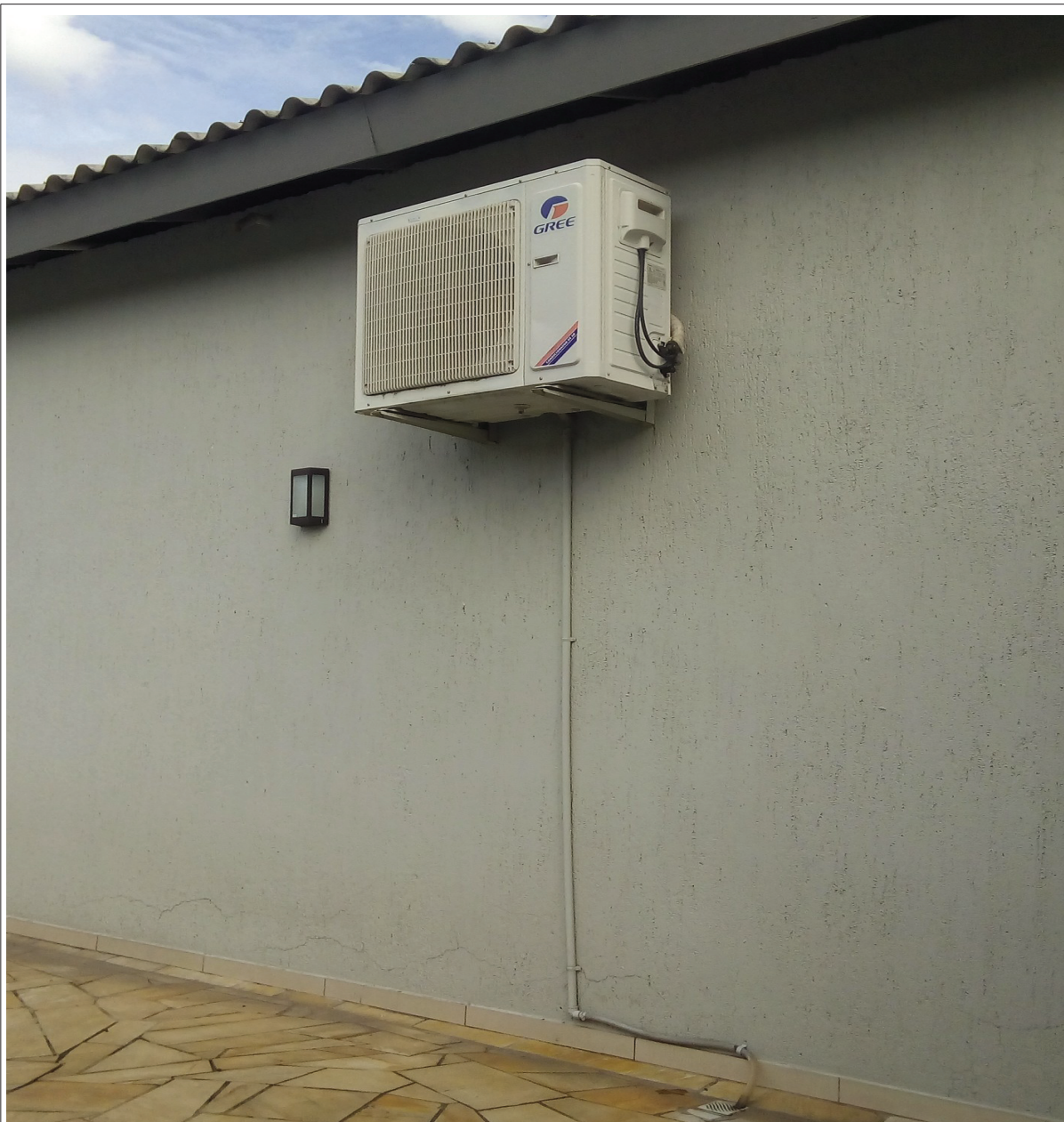
Foto 2 – Situação de instalação das unidades condensadora e evaporadora, item 3.1.1