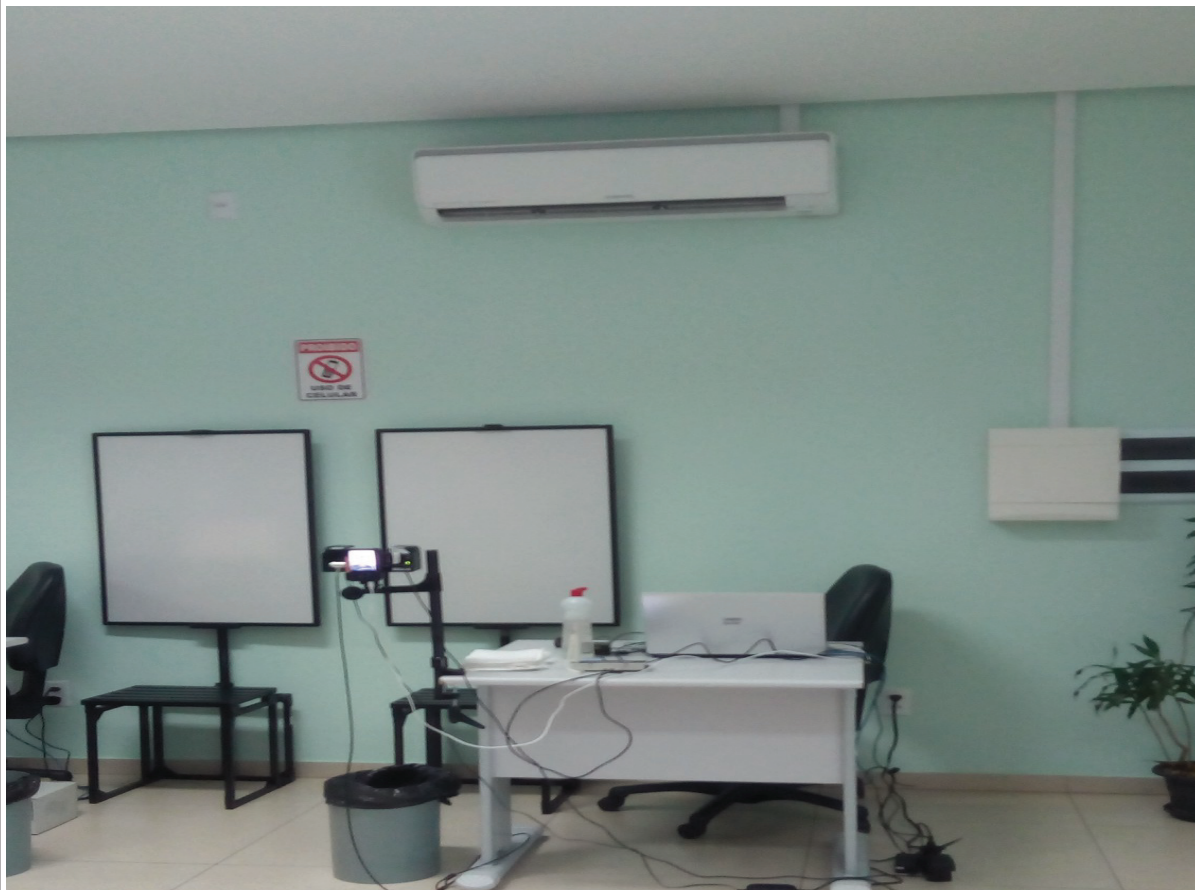
Foto 3 – Situação de instalação das unidades condensadora e evaporadora, item 3.1.2