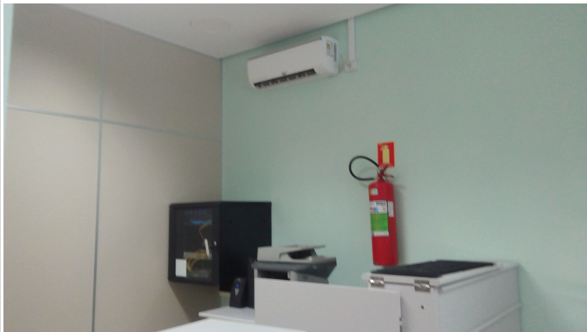
Foto 5 – Situação de instalação das unidades condensadora e evaporadora, item 3.1.3