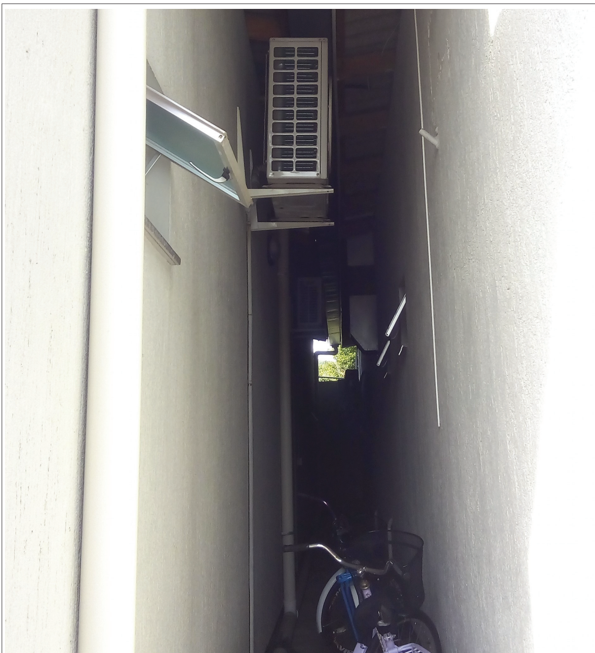
Foto 4 – Situação de instalação das unidades condensadora e evaporadora, item 3.1.2